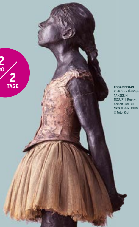
EDGAR DEGAS VIERZEHNJÄHRIGE TÄNZERIN 1878/811, Bronze, bemalt und Till SKD ALBERTINUM

Hotline +49 351 501 501 E-Mail info@dresden.travel www.dresden.de/tourismus