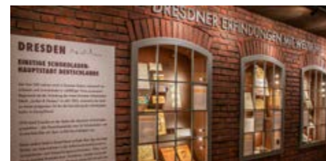
Dresdens glanzvolle Schokoladengeschichte