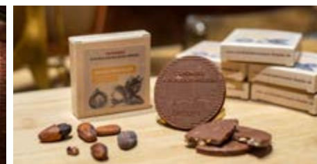
Ein veredelter Museumstaler als Geschenk

Den Anfang macht die Bohne. Damit Schokolade ein echter Genuss wird, muss ein Chocolatier die passende Kakaosorte auswählen: Kräftig, mild, ein wenig fruchtig oder blumig können die Aromen von Kakaobohnen sein. Wie sie sorgfältig verarbeitet werden und ein Stück richtig gute Schokolade schmeckt, erfahren und erleben Sie im CAMONDAS Schokoladenmuseum auf der Schloßstraße.